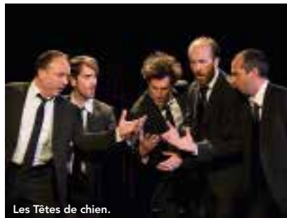
Les Têtes de chien.