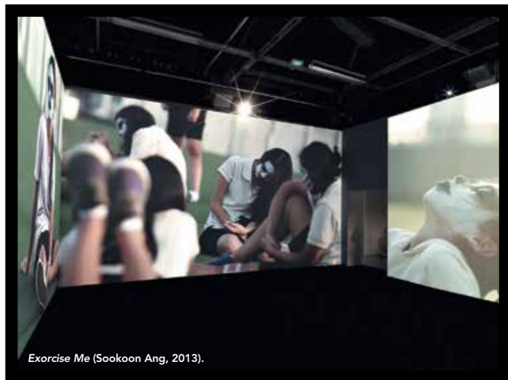
Exorcise Me (Sookoon Ang, 2013).