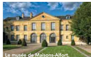
Le musée de Maisons-Alfort.