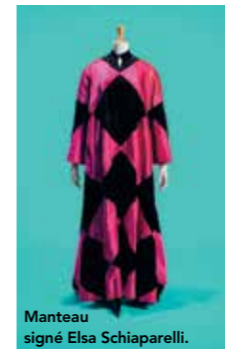
Manteau signé Elsa Schiaparelli.