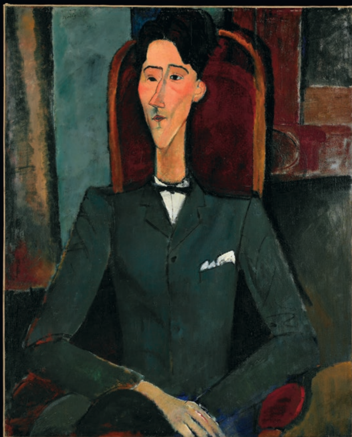
Jean Cocteau (Modigliani, 1916).